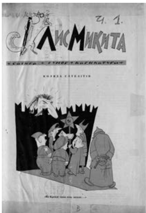
8 Lys Mykyta [Der Fuchs Mikita, ukr.], München Abb.: BSB