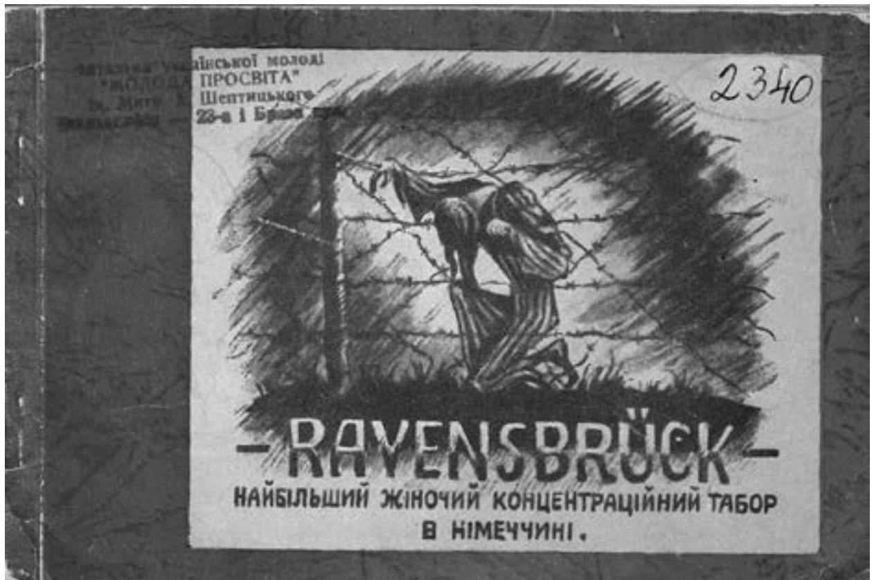
3 Ravensbrück: najbilšy žinočyj koncentracijnyj tabor v Nimeččyni [Ravensbrück: das größte Frauen-Konzentrationslager in Deutschland, ukr.], München 1947