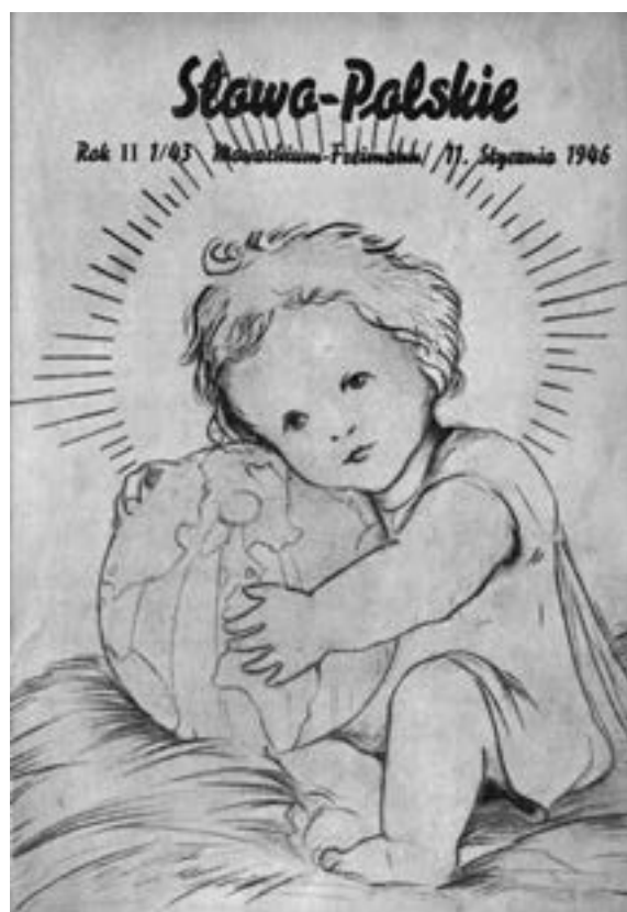
7 Słowa-Polskie [Das Polnische Wort], München-Freimann Abb.: BSB