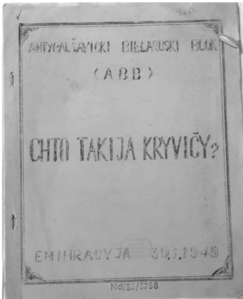
4 Chto takija kryvičy? [Was sind Kriwitschen, belaruss.], o.O., 1949

ratury). Zu vermuten ist, dass auch die amerikanische Besatzung nach dem Beginn des Kalten Krieges solche Publikationen nicht ungern sah. 1945–1946 noch wäre eine Publikation über das Volk der Kriwitschen vom Belarussischen antibolschewistischen Block undenkbar gewesen (vgl. Abb. 4).