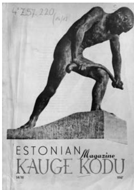
9 Kauge Kodu [Entfernte Heimat, estn.], Augsburg Abb.: BSB