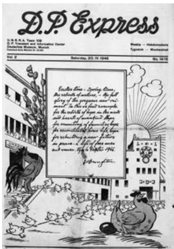
6 D.P. Express , München